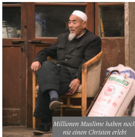
Millionen Muslime haben noch nie einen Christen erlebt

Die Zeit der Gebetsinitiative ist abgelaufen. Doch Gottes Arbeit in Asien scheint erst richtig zu beginnen. Es gibt so viele Möglichkeiten, Teil von seiner Geschichte unter Asiaten zu sein. Sei mit dabei! S+A.