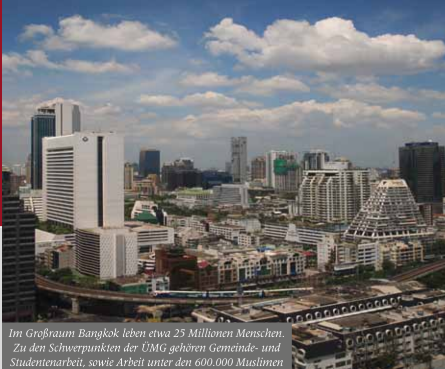
Im Großraum Bangkok leben etwa 25 Millionen Menschen. Zu den Schwerpunkten der ÜMG gehören Gemeinde- und Studentenarbeit, sowie Arbeit unter den 600.000 Muslimen