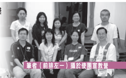
筆者（前排左一）攝於使團宣教營