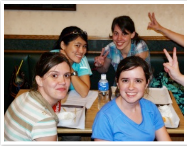
Einige Teilnehmer des internationalen teams