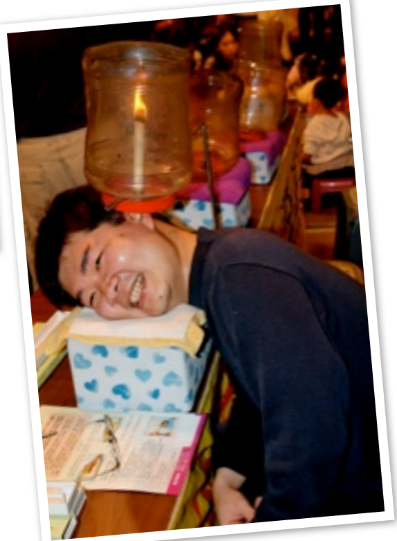
Nachtmarkt mit endlosen neuen Erfahrungen