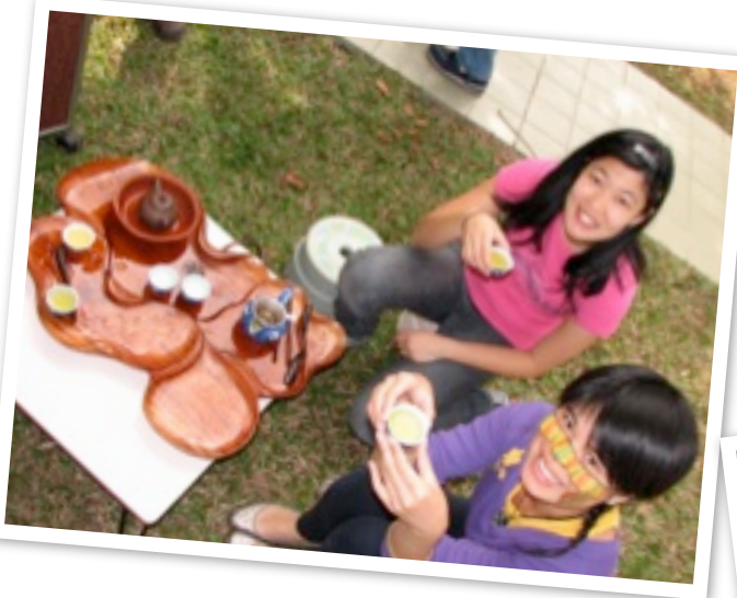
Teetrinken auf Taiwanesisch