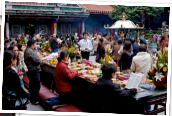
Tempelbesuche und Gebetsmärsche